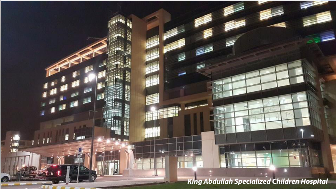
King Abdullah Specialized Children Hospital

القسطرة يتم ازالها فور الوصول للوريد. ولا يبقى سوى هذه القسطرة الرفيعة التي تترك غالبا في مكانها لعدة ساعات أو أيام حتى يتسنى اعطاء المريض الأدوية والسوائل دون الحاجة لإجراء حقن آخر، ويمكن في بعض الأحيان أخذ عينات الدم من خلالها.